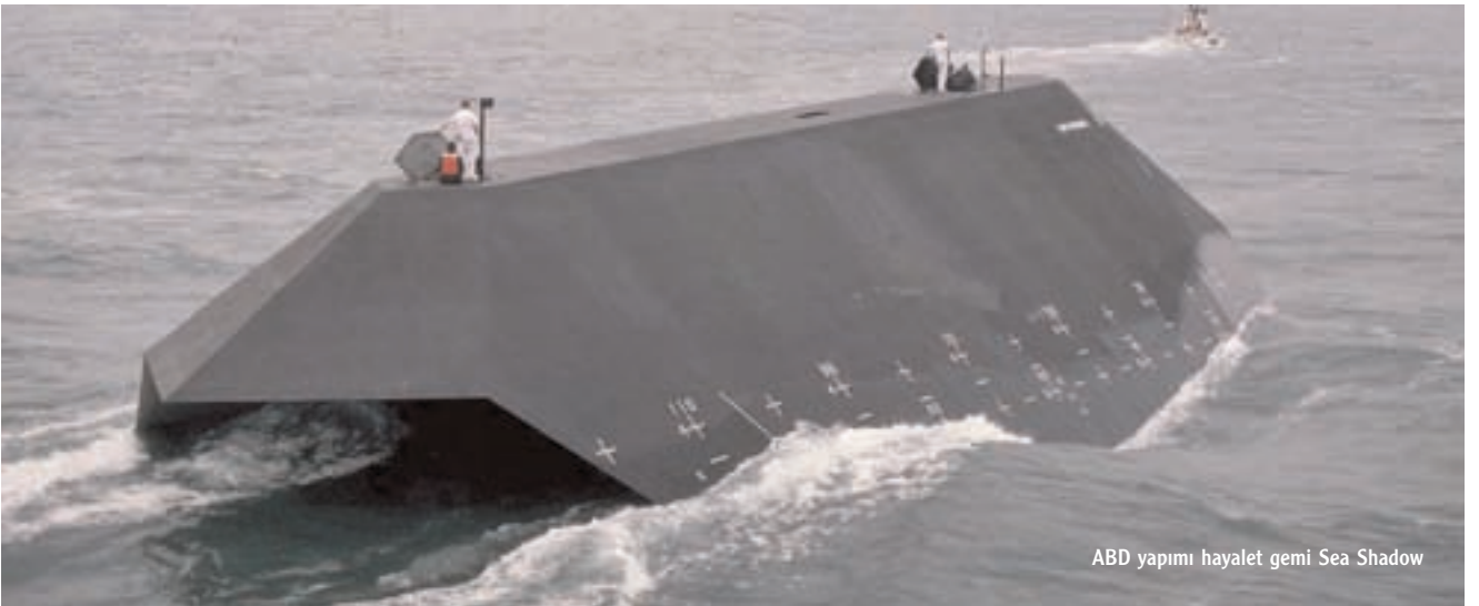
ABD yapımı hayalet gemi Sea Shadow

Hayalet gemiler arasında farklı tasarımıyla göze çarpan örneklerden biri, ABD yapımı Sea Shadow (Deniz Gölgesi). Gemi küçük su seviyeli çift gövdeli (SWATH, small waterline area twin hull) adı verilen yeni bir tasarımla üretilmiş. Geminin ilk örneğinin 1985 yılında üretildiği, söyleniyor. Ne