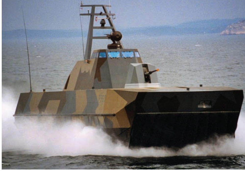
Norveç yapımı Skjold sınıfı bu gemi sahil güvenlik ve devriye görevlerini yerine getirmek üzere tasarlanmıştır

Dünya donanmalarında bir süredir hayalet gemiler kullanıma girmiş bulunuyor. Bu gemilerin ilki İsveç donanmasında görev yapan Visby adlı gemiydi. Sonradan yapılan gemiler de bu ada gönderme yapılarak Visby sınıfı olarak adlandırıldılar. Bunlardan başka, İngiliz donanmasında "Type 45" adı verilen destroyer, Fransız donanmasında, La Fayette sınıfı fırkateynler, Norveç donanmasında Skjold sınıfı devriye botları, Alman Braunschweig sınıfı korvetler, ABD'ye ait, Zumwalt sınıfı destroyerler hâlihazırda görev yapıyorlar. Farklı görevlerde hizmet