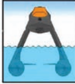
Hızlı seyir düzeni