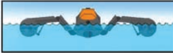
Çok sığ sularda seyir düzeni