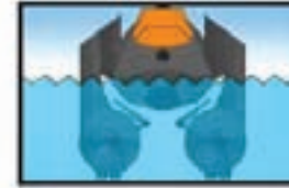
İndirme ve geri yükleme düzeni

var ki gemi uzun süre gizli kalmış ve sadece özel görevlerde kullanılmış. Geminin halka duyurulmasıysa 1994 yılında, stealth teknolojisinin deniz araçlarında kullanılmaya başlanmasının tasarlandığı dönemde olmuş. Bu gemide aynı zamanda sevk ve idare için çok az personel kullanılması, işlerin büyük bir kısmının otomatikleştirilmesi denenmiş. Geminin su altında kalan bölümünde iki gövde yer alıyor ve gemi bu çift omurga üzerinde yükseliyor. Bunların ucundaysa geminin ilerlemesini sağlayan birer pervane, geminin arka kısmını sabit tutmak için bir sabitleyici düzenek ve denge sağlamak için küçük kanatçıklar bulunuyor. Bu tasarım gemiye sağlam bir duruş veriyor. Denizin çalkantılı olduğu hatta şiddetli fırtına ortamlarında bu tasarım, güven yaratıyor. Geminin bu tasarımını Amerikan iç savaşı sırasında kullanılan "ironclad" (demircaplı) tipi gemilere benzetenler de var. Sea Shadow, aslında ünlü bir gemi sayılır. 1997 yılında çekilen "Yarın Asla Ölmez" (Tomorrow Never Dies) adlı James Bond filminde bu geminin stealth özelliği taşımayan bir benzeri kullanılmış.