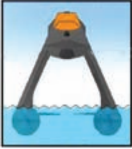
Yavaş seyir düzeni

ABD'nin Lockheed-Martin firması tarafından tasarlanan CHARC adlı bu gemi katlanıp açılarak değiştiği şekliyle "hayalet" teknolojisinin yanına çok amaçlı kullanılabilme kabiliyetini ekliyor.